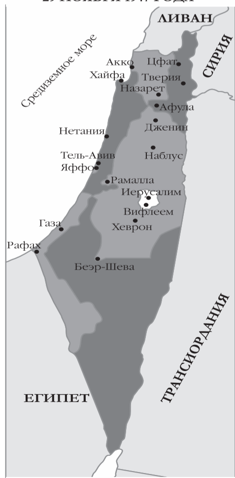
ПЛАН РАЗДЕЛА, ОДОБРЕННЫЙ ГЕНЕРАЛЬНОЙ АССАМБЛЕЕЙ ООН, 29 НОЯБРЯ 1947 ГОДА

■ Еврейское государство ■ Арабское государство □ Город Иерусалим